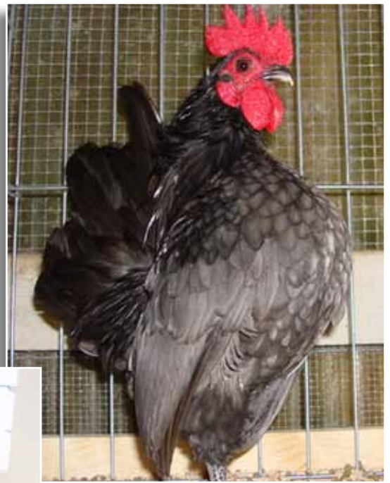
Blueboy, showwinnaar in 2007 van Jerry, let op het grote oog, korte vleugels en goed veerkwaliteit.

Alle blauwe Serama's en Serama's met blauw erin zijn dieren die van mij afkomstig zijn. De foute dieren gingen naar Frankrijk via een handelaar (als boerenkrielen) tot eind 2009. De blauwe Serama's zijn hybriden