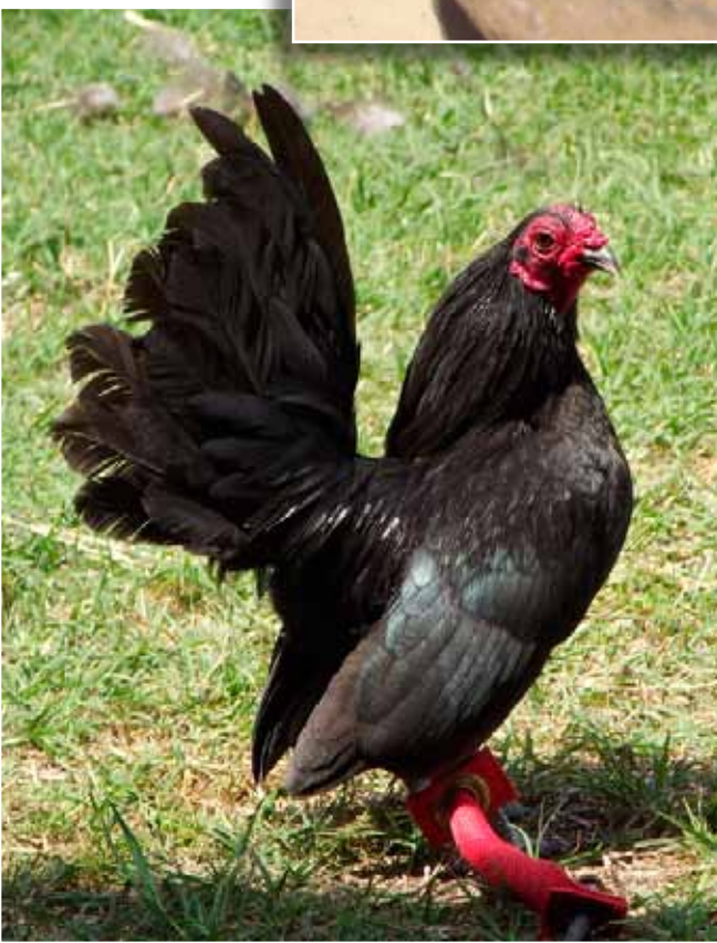
Links: Zwarte OEGB van Soda Bottle Seramas Georgia. Kam afsnijden is in Amerika nog niet verboden.