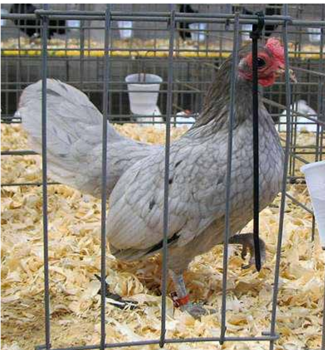
Splash OEGB hen van SunnyChick Florida.